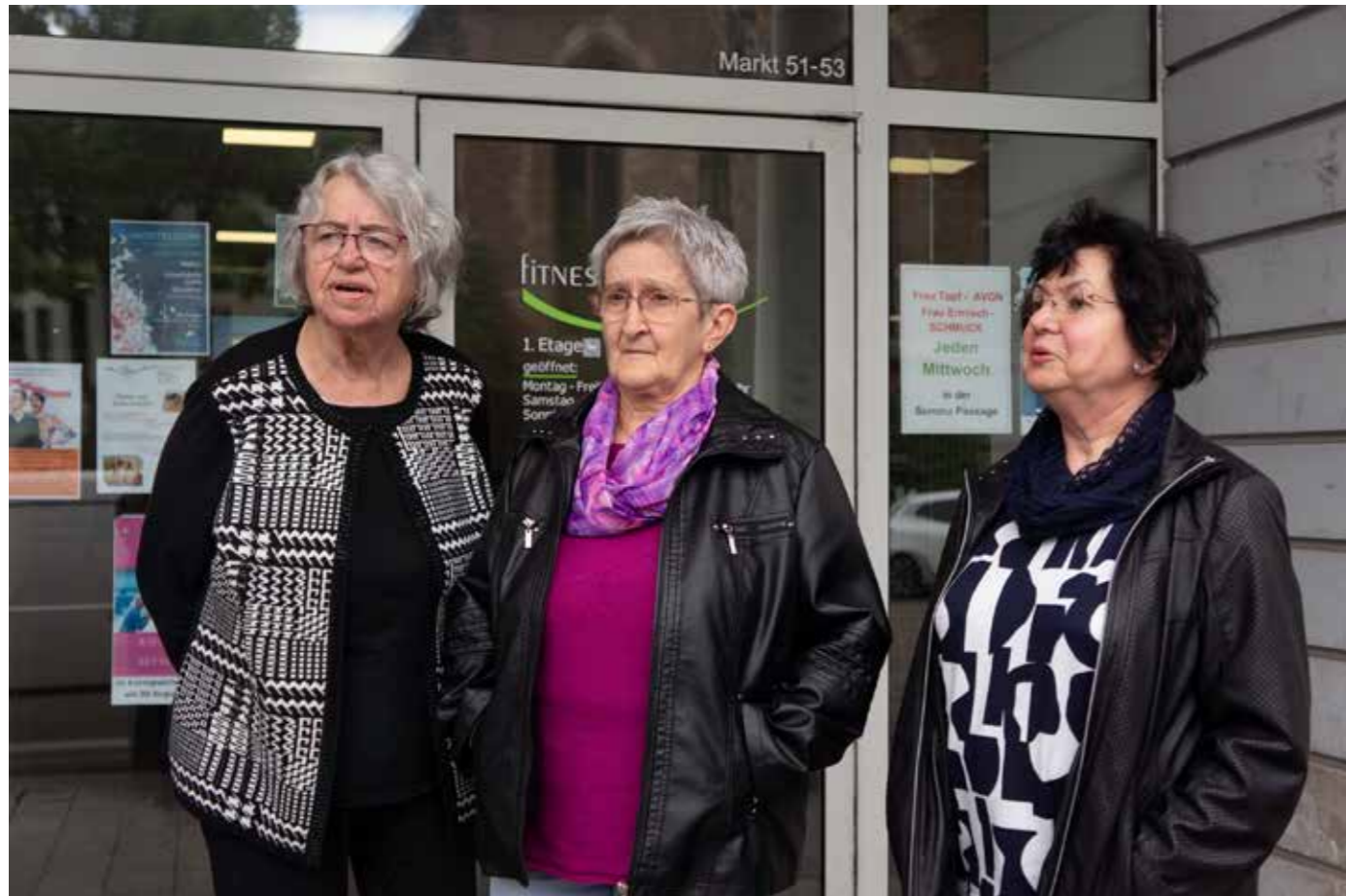
Neulich hat mich einer begrüßt mit „Muttchen“! Ich bin kein Muttchen, und auch kein Pflegefall, zumindest ich nicht! Wir hier sind ringsum beschäftigt.