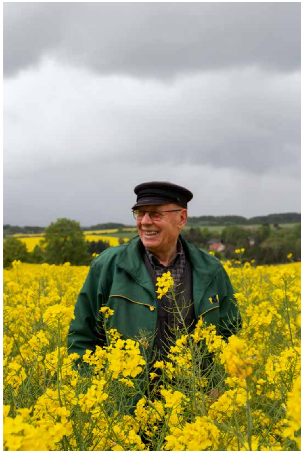
Einer meiner Lieblingsorte ist der Sommerberg, von dem aus man so gut das Dorf und den Kirchturm sehen kann. Bei dem Wiederaufbau des Turms habe ich mich aktiv beteiligt. Mein ältester Enkel wurde in dieser Kirche konfirmiert. Das hat mich sehr stolz und glücklich gemacht. Ich freue mich jedes Mal, wenn ich die Glocken läuten höre.