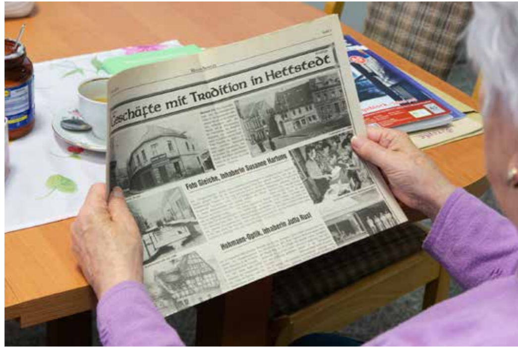
Schau mal, was ich gefunden habe! Das müsste alles weg sein hier, da wo der Penny ist. Vieles haben sie abgerissen, die ältesten Häuser. Für den Busbahnhof.